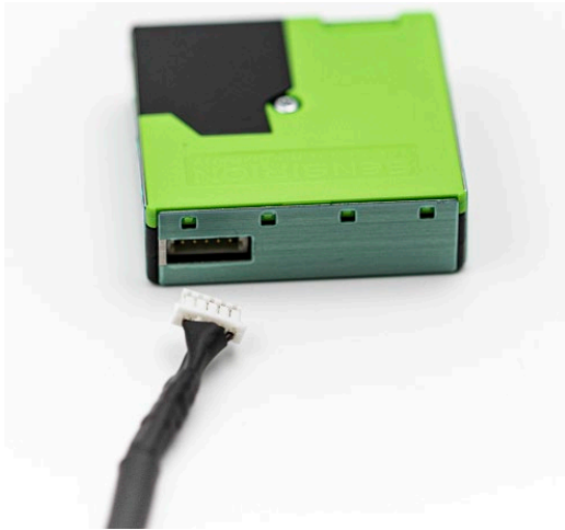
Abb. 3: Anschluss Sensorkabel an Partikelsensor

Die Codierungsstifte an den Seiten des Steckers erlauben nur eine richtige Einbauvariante.