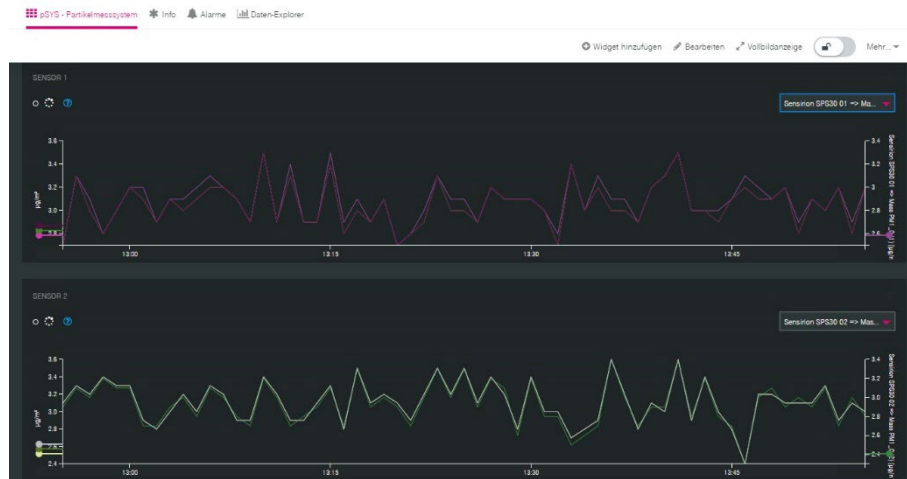
Abb. 5: Beispiel für ein Dashboard in der Telekom Cloud

Sie können das Dashboard bearbeiten und z.B. den Namen ändern, die Ansicht anpassen, das Dashboard aber auch löschen oder weitere Dashboards hinzufügen.