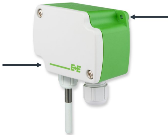
Abb. 4: Einbaupositionen des Kombinationssensors für Temperatur und Feuchtigkeit